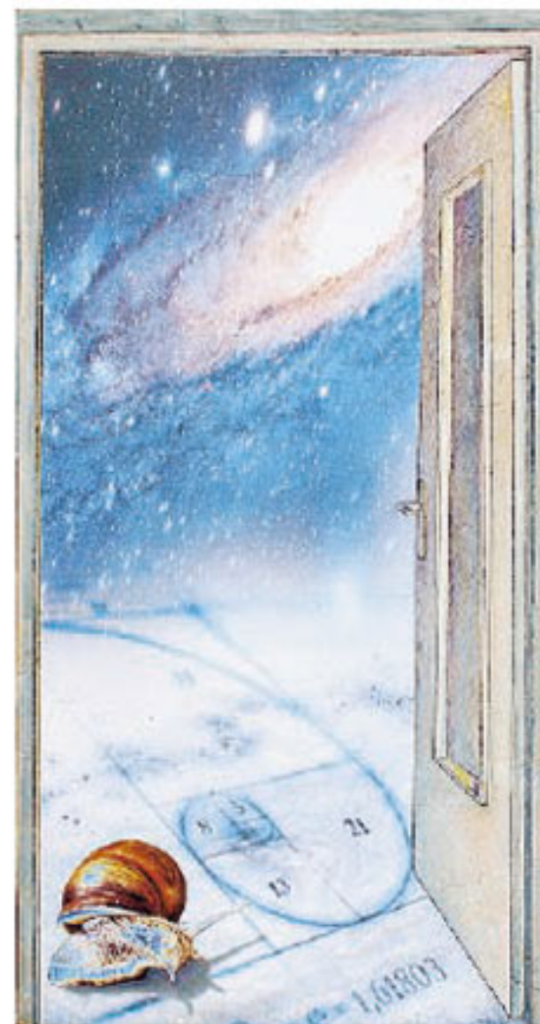
Una delle opere esposte a Cherasco

Presento una serie di nuovi lavori realizzati sulla base della mostra "Respiro"