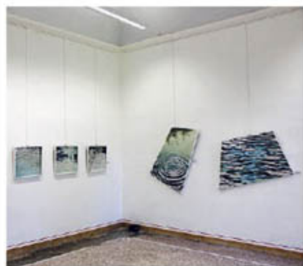
Un altro particolare dell'allestimento in mostra