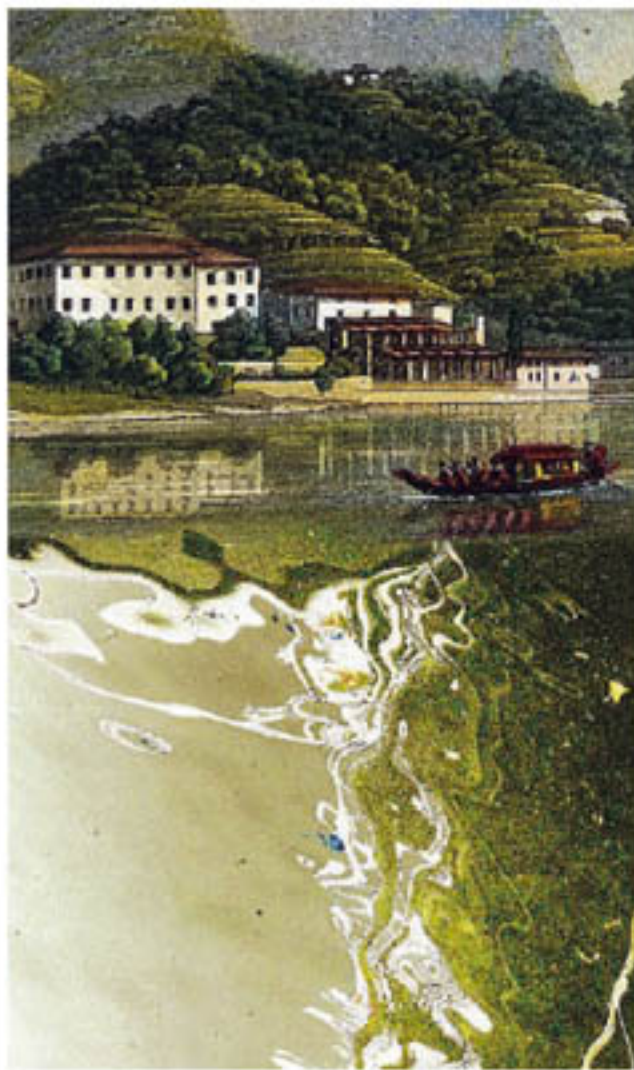
Una veduta di Villa Mainona a Tremezzo, sede del museo del territorio, in una rivisitazione artistica firmata dal maestro comasco Emilio Alberti

«Ho chiamato la serie "Fluidi Istanti" e rappresenta - dice l'artista comasco - dettagli minimi stilizzati, quasi astratti: il particolare di un riflesso, il moto istantaneo di una piccola onda, uno spruzzo, una vibrazione sulla superficie, come attimi sospesi. Lo spunto è sempre il lago. Alcune delle immagini sono riprodotte in stampa ed esposte nella mostra in un confronto dialettico con i