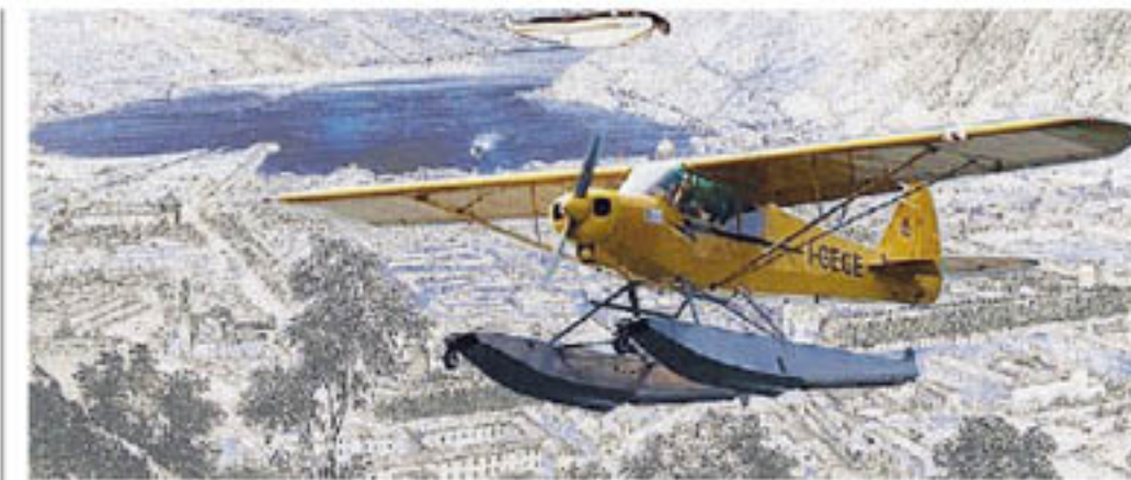
A sinistra, un dipinto di Alberti esposto a Tremezzina. Sopra, altro omaggio al Lario